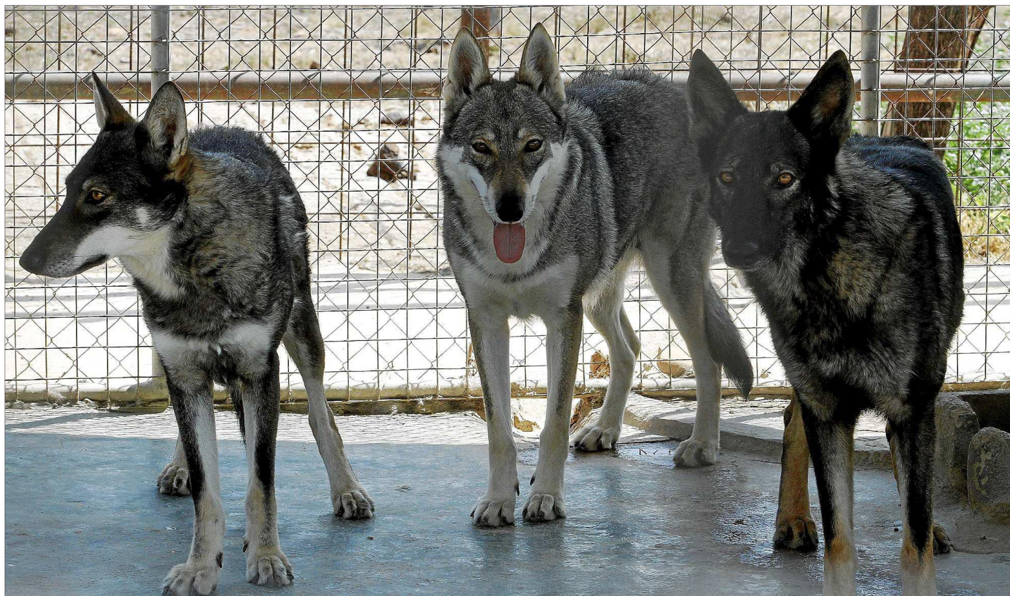
Tres hembras de perro lobo de Ibérico en su espacio del centro canino. Lo protegen dando la alerta ante la llegada de extraños.