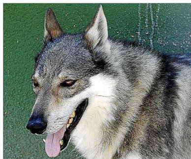
'Kaiser', un perro lobo Checoslovaco. A la derecha, un bonito ejemplar de perro lobo de Saarloos.