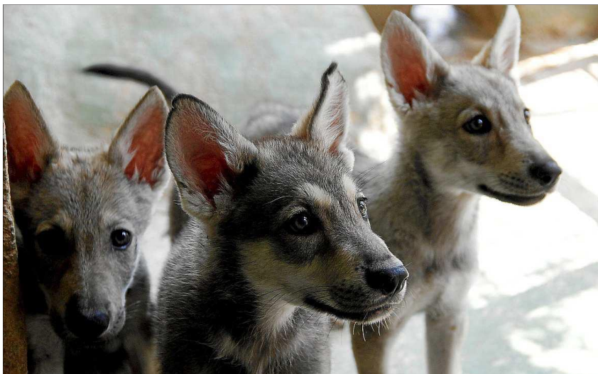
Los últimos cachorros nacidos en el centro son perros lobo Ibérico-Saarloos.