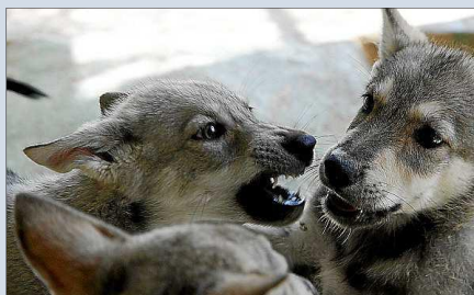
Dos de los últimos cachorros, jugando en su jaula.

El adiestramiento del perro lobo nunca debe ser bajo amenaza o castigo. «Son tan inteligentes que no se les olvida. Los cachorros tienen que vivir en una familia adecuada, con espacio y tiempo suficiente para dedicárselo. Las hembras tienen un único celo al año y las camadas pueden llegar a ser de once cachorros, aunque lo habitual suelen ser de seis. Los machos también cooperan en la crianza de los cachorros».